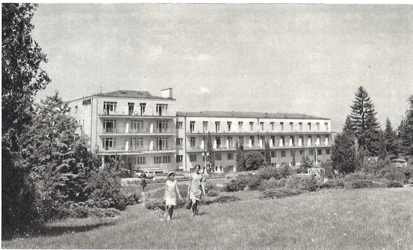
Liečebný dom Palace na Sliachi