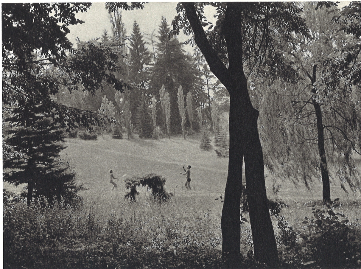
Zákutia kúpeľného parku na Sliachi